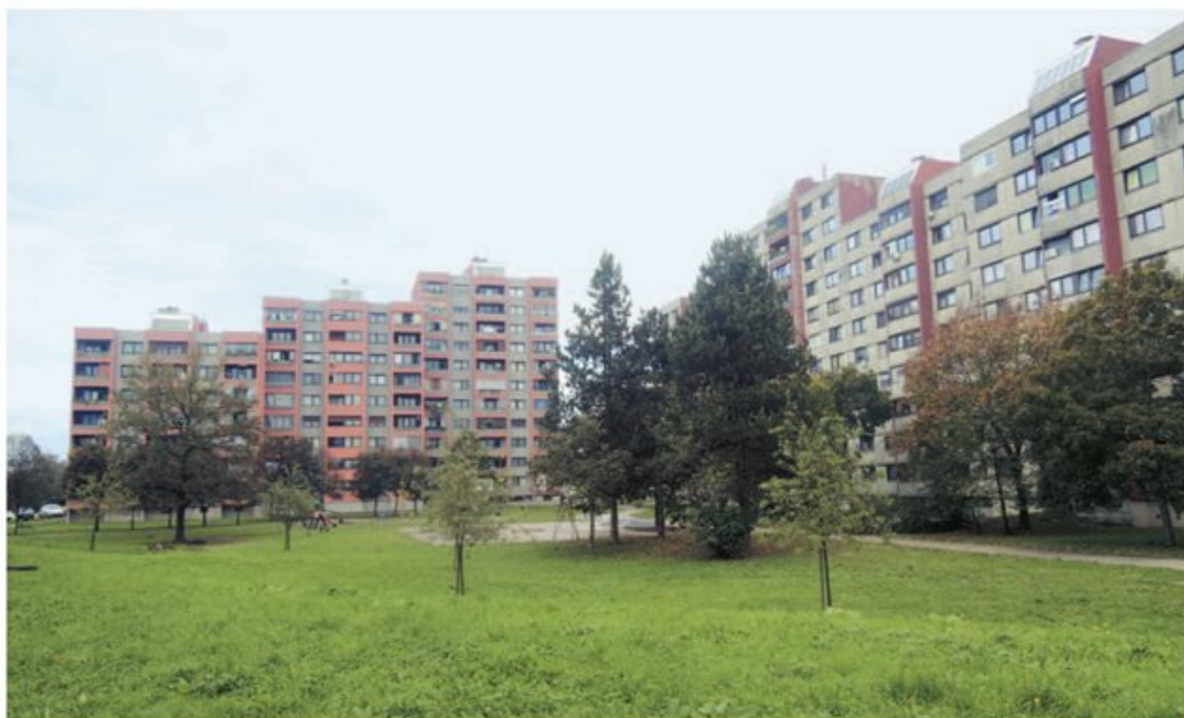
Stanovalce želijo spodbuditi k aktivnemu sodelovanju za večjo kakovost življenja v Dečkovem naselju in Novi vasi. (Metka Pirc)