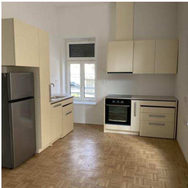
( https://www.stajerskival.si/assets/news_album_pic/img4439.JPG )