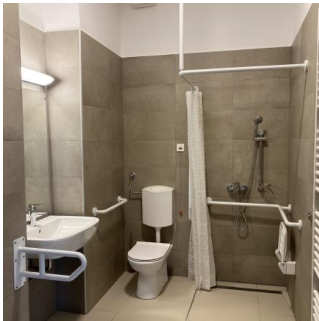
( https://www.stajerskival.si/assets/news_album_pic/img4438.JPG )