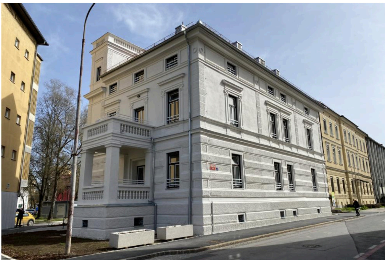
Objekt iz leta 1880 je zasijal v osveženi podobi.

Zaključena je obnova in rekonstrukcija Vile Vodnikova 14 v Celju. V objekt, ki je zavarovan kot kulturna dediščina, so uredili 12 oskrbovanih stanovanj. Javni razpis za dodelitev stanovanj je v teku, stanovalcem naj bi ključke razdelili še pred poletjem.