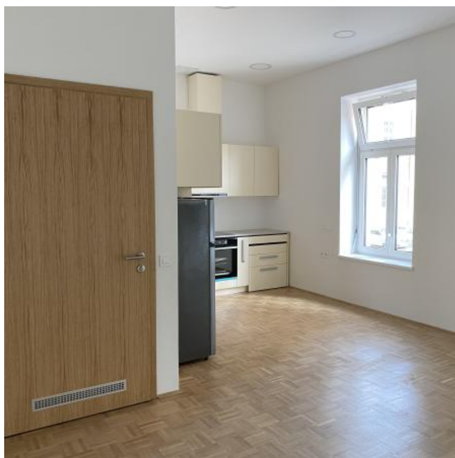
( https://www.stajerskival.si/assets/news_album_pic/img4436.JPG )