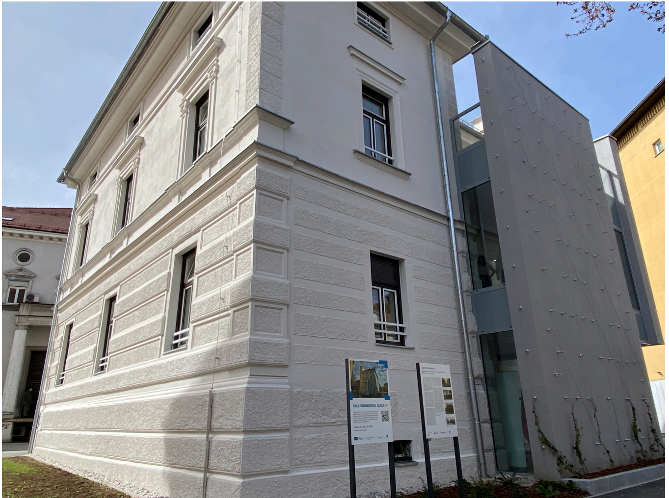
Stavba je zavarovana kot kulturna dediščina.

Objekt je v neposredni bližini Zdravstvenega doma Celje, celjske bolnišnice, lekarne, trgovine, bančnih, upravnih in drugih storitev, stanovanja so namenjena bivanju starejših občanov.