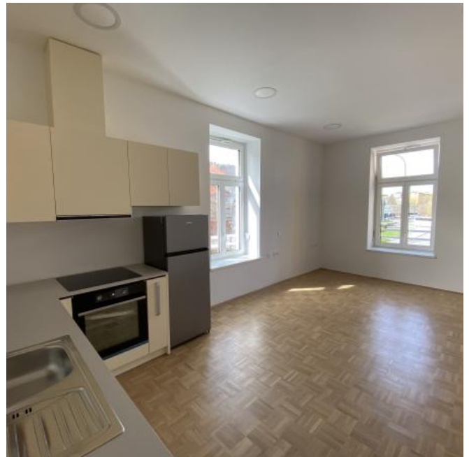
( https://www.stajerskival.si/assets/news_album_pic/img4449.JPG )