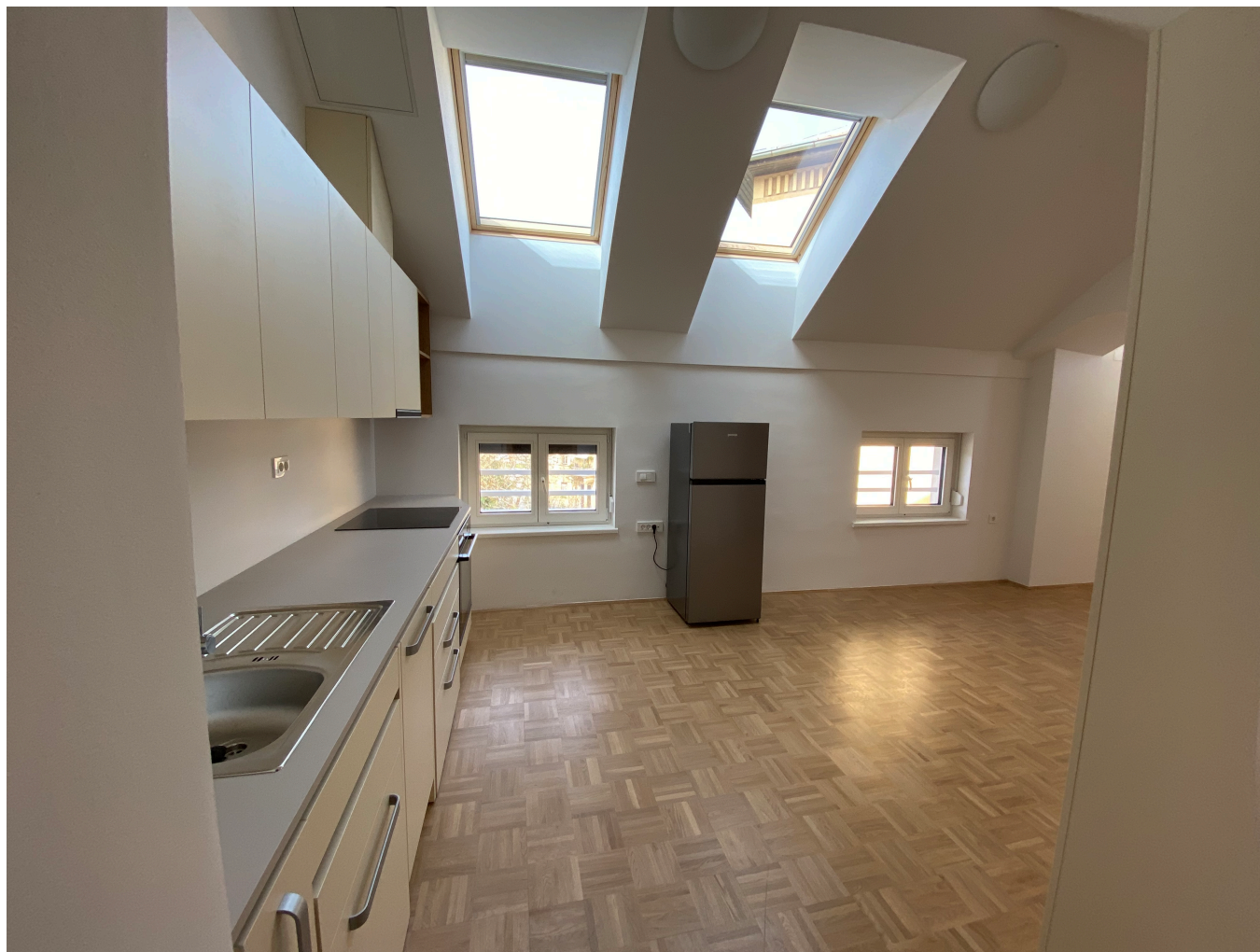
Štiri stanovanja so namenjena dvočlanskim gospodinjstvom, ostalih osem pa bivanju ene osebe.

Upravičenci morajo ob tem izpolnjevati še nekatere druge pogoje javnega razpisa, ki je objavljen še do 12. aprila. Cene za najem oskrbovanih stanovanj se bodo gibale od okoli 250 evrov za najmanjša in do okoli 350 evrov za največja stanovanja. Ključne bodo novim stanovalcem razdelili še pred poletjem. V galeriji si pogledajte nekaj fotografij prenovljenega objekta. (NS)