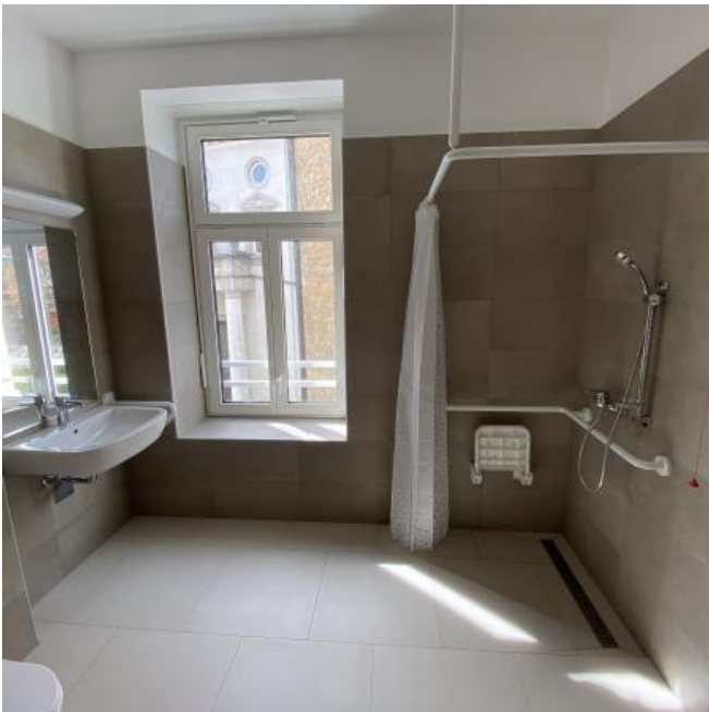
( https://www.stajerskival.si/assets/news_album_pic/img4450.JPG )