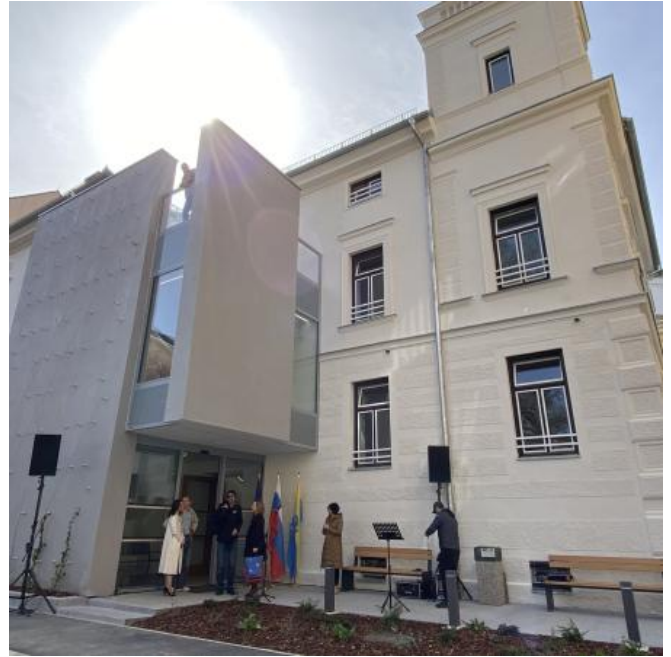
( https://www.stajerskival.si/assets/news_album_pic/img4451.JPG )