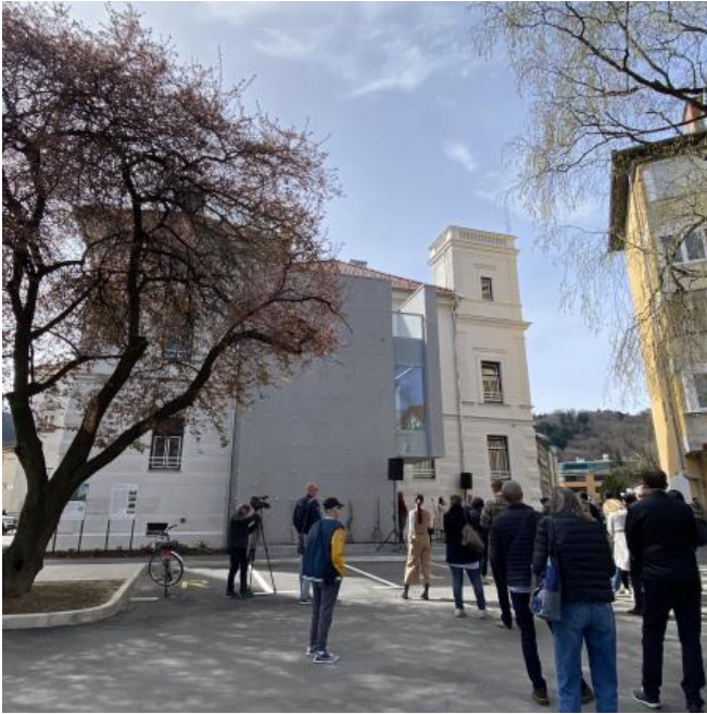
( https://www.stajerskival.si/assets/news_album_pic/img4458.JPG )