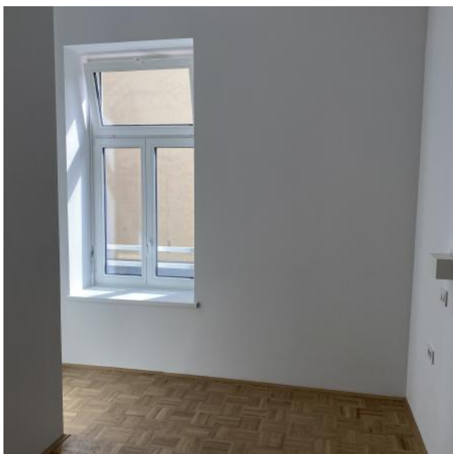
( https://www.stajerskival.si/assets/news_album_pic/img4437.JPG )